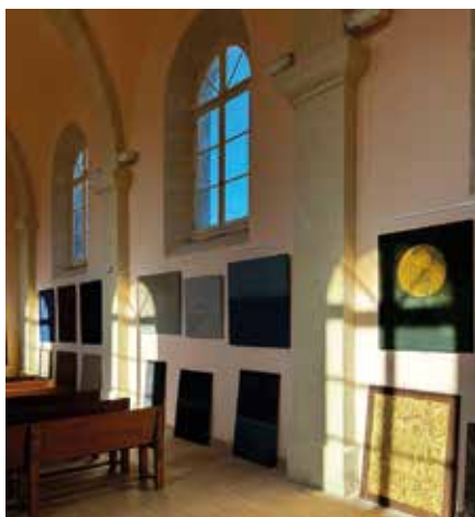
Exposition au Temple