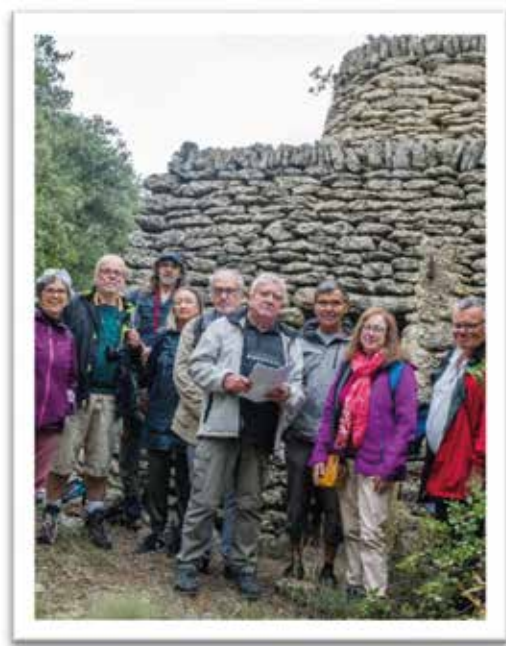
Visite guidée sur les chemins de Catet

Les journées européennes du patrimoine ont permis à l'ASSV de réaliser une opération pédagogique enrichissante auprès des élèves de l'école de Villevieille, relative au site de la domus antique sur le site des terriers et à cette époque gallo-romaine ou notre village a connu une période resplendissante. Deux visites guidées dans les chemins de Catet ont permis à des petits groupes, de découvrir une partie du patrimoine de Villevieille : constructions en pierre sèche et flore.