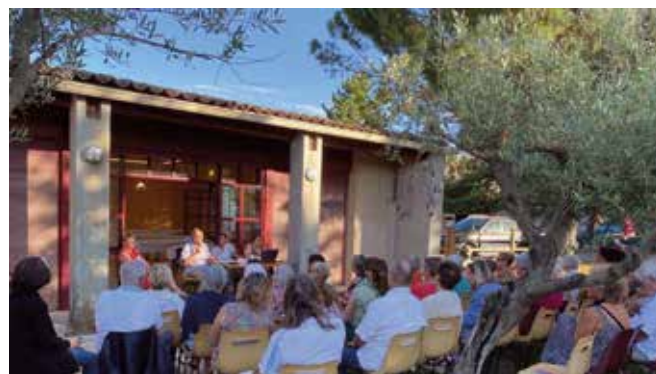
Assemblée Générale - JUIN 2024

SEL'ÉCHANGE se retrouve en principe le deuxième lundi de chaque mois au foyer. Si l'on y parle d'échanges, de services, de la marche du SEL, on se retrouve surtout autour de magnifiques buffets de Sucré-Salé que l'on partage dans le style « Auberge Espagnole ».