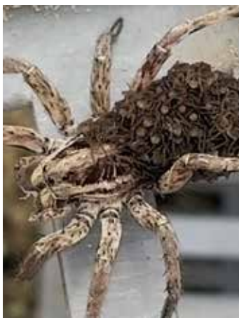
Araignée femelle portant ses petits