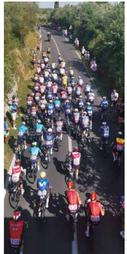
Tour de France