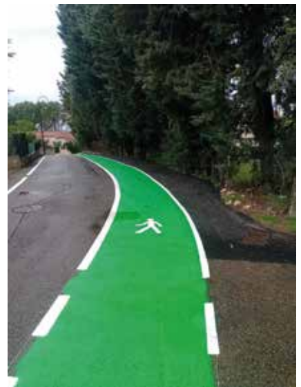
Chemin des Pradels