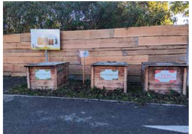
Bardage en bois