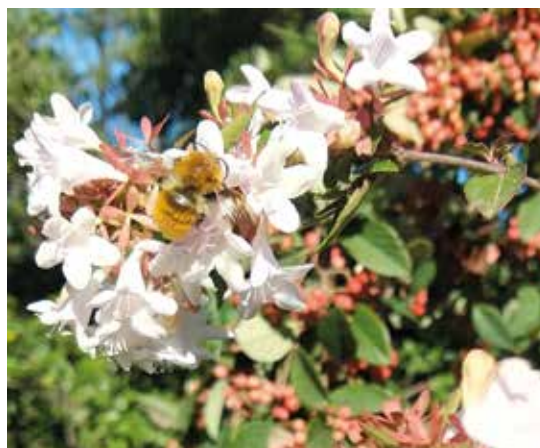
Bourdon sur fleurs d'Abelia grandiflora Parking du château de Villevieille Octobre 2024